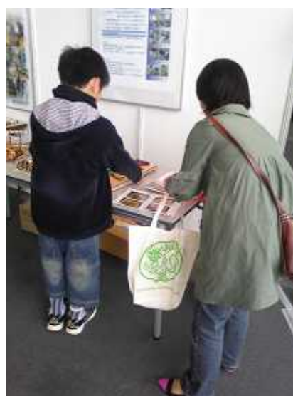
作品に感激する小学生